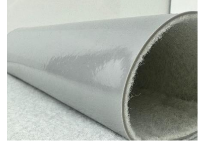
SKYPLAST® LP PVC Geomembrane + PP GTX

Bu serinin en önemli özelliklerinden biri polipropilen (PP) geotekstil keçe laminasyonudur. PVC geomembran, özel olarak kontrol edilen ısı ve basınç yöntemiyle polipropilen geotekstil keçe ile bütünleşik hale getirilir. Bu proses, keçe ile PVC tabaka arasında güçlü, homojen ve uzun ömürlü bir bağ oluşturur. Keçe laminasyonu; zeminle temas eden yüzeyde ilave koruma sağlar, delinme ve mekanik hasarlara karşı direnci artırır, yüzey gerilmelerini dengeler ve uygulama sırasında daha stabil ve güvenli bir serim yapılmasına katkı sağlar.